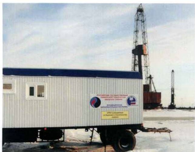
Модуль ДИПО на Вать-Еганском месторождении (ООО «ЛУКОЙЛ-Западная Сибирь»)

Целенаправленная многолетняя интеграция производства, образования и науки на основе супервайзинга бурения и нефтегазодобычи обеспечивает синергетический эффект – создание новых технологий управления рисками при строительстве скважин, а также учебных дисциплин, научных направлений и профессий.